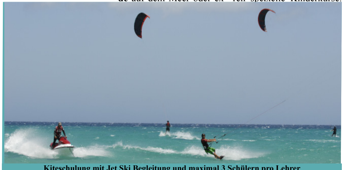
Kiteschulung mit Jet Ski Begleitung und maximal 3 Schülern pro Lehrer

Das Team sorgt mit seinem ausgebildeten Rescuepersonal für professionelle Sicherheit . Von erhöhten Wachposten aus wird das Geschehen auf dem Meer beobachtet und die Rettung per Jet Ski wird via Funk auf dem Meer koordiniert und bis zum Abschluss überwacht.