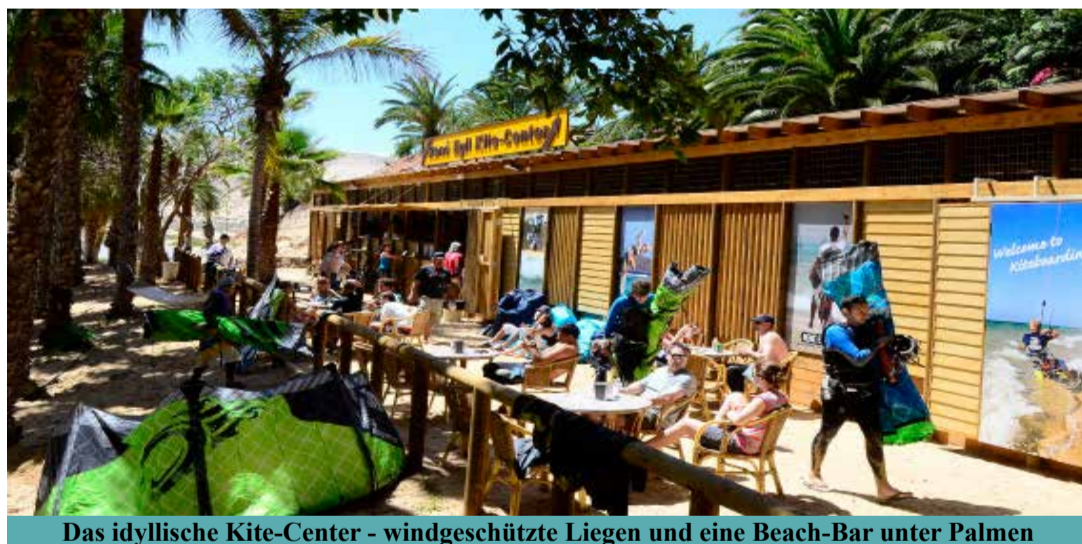
Das idyllische Kite-Center - windgeschützte Liegen und eine Beach-Bar unter Palmen

Das professionelle Lehrteam bietet Kurse für alle Könnenstufen - auf Wunsch als Privatkurs - mit neuestem Material. In kleinen Lerngruppen lässt der Fortschritt nicht auf sich warten - und auch für die Kleinsten gibt es ab 8 Jahren spezielle Kinderkurse.