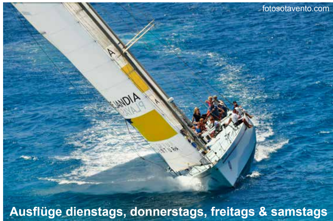
Ausflüge dienstags, donnerstags, freitags & samstags

Die berühmte Segelregatta rund um die Welt wurde 1973 zum ersten Mal ausgetragen. Nach einem Sponsorenwechsel trägt sie seit 2001 den Namen „Volvo Ocean Race“.