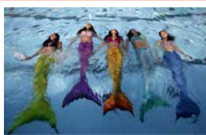
Meerjungfrauenschwimmen ab sofort bei uns buchbar

schwimmen? Braucht es noch das Seepferdchen? Oder möchten sie endlich mal effektiv das Kraulen erlernen, um erfolgreich ausdauernd schwimmen zu können? Egal ob Urlauber oder Resident, die Schwimmschule Sharky, Europas größte und erfolgreichste Schwimmschule bringt Kindern spielerisch