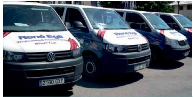
kostenloser Shuttle Service inklusive

Die zwei René Egli Center liegen unmittelbar am Hotel Melia Gorriones unter schattenspendenden Palmen. In windgeschützten Liegeoasen kann man herrlich relaxen, die Beach-Bar sowie Süßwasserduschen