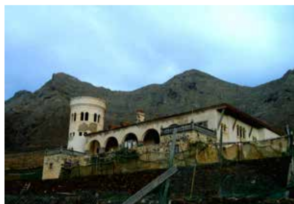
Villa Winter Archiv 2007

dem er vor einigen Jahren seinen Onkel und seine Tante dort verwahrlost und krank aufgefunden hatte, versuchte er, das Bauwerk mit allen Mitteln zu erhalten und zu restaurieren. Als Kind soll