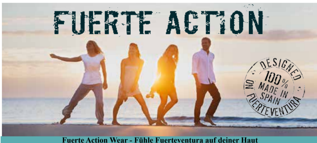
Fuerte Action Wear - Fühle Fuerteventura auf deiner Haut